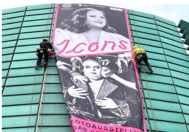
Ikoner i Tyskland i samarbete med Sveriges ambassad i Berlin.